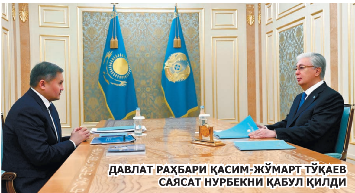
ДАВЛАТ РАҲБАРИ ҚАСИМ-ЖҰМАРТ ТҰҚАЕВ САЯСАТ НҰРБЕКНИ ҚАБУЛ ҚИЛДИ

Президентга меҳнат бозорини таҳлил қилиш натижалари ҳамда 2030 йилгача кадрларга бўлган эҳтиёж тахминлари ҳақида маълумот берилди. Шунингдек, олий таълимдан кенгроқ фойдаланишни таъминлаш, жумладан, "Келешек" дастагини жорий этиш ва соҳани молиялаштиришнинг янги шаклини амалга ошириш чоралари ҳақида сўз юритилди.